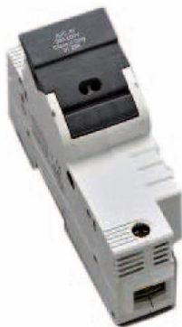
Foto del prodotto / Product image